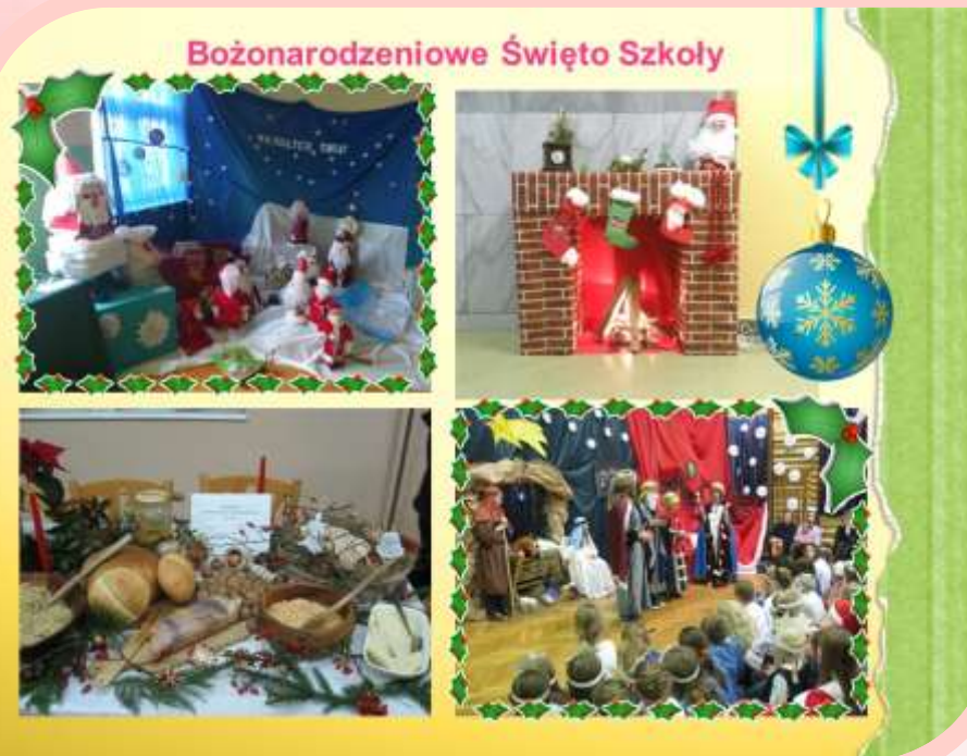
Bożonarodzeniowe Święto Szkoły